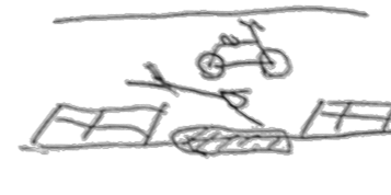
車道から歩道に自転車移動する際段差に躓き転倒した。