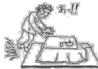
カーペットの端に足先が引っ掛かり躓いて転倒した。